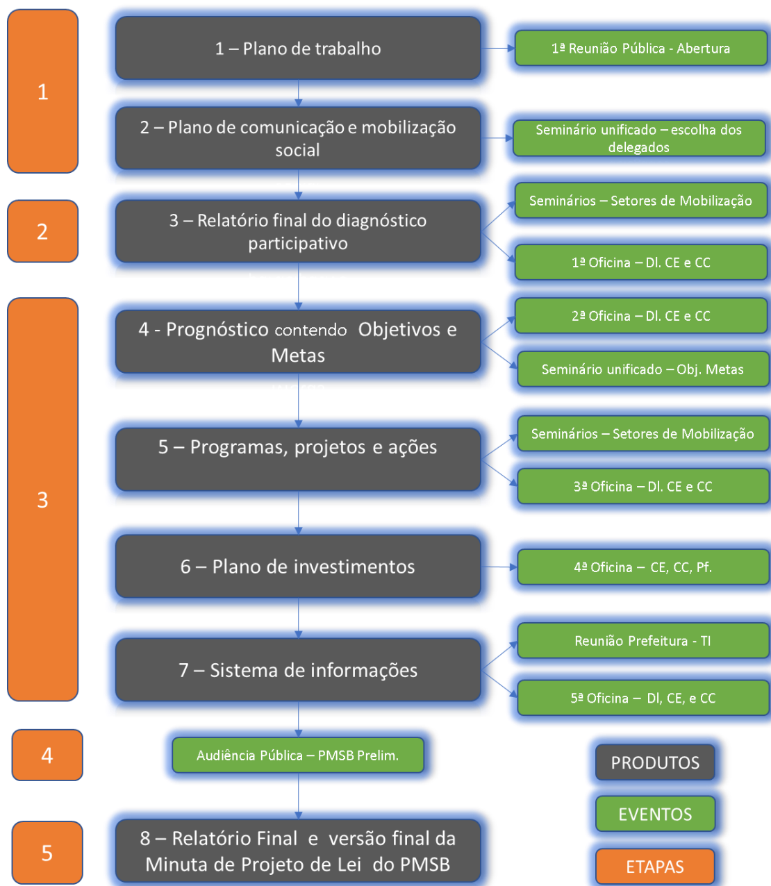
Figura 1 – Etapas, produtos e eventos.